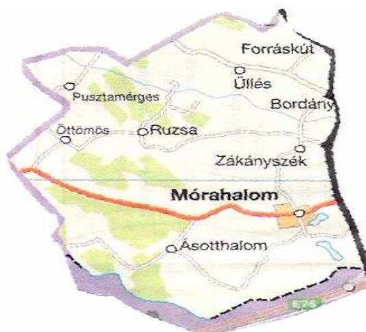
1. kép Az őrs illetékességi területe