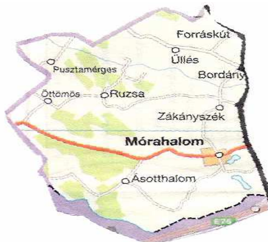
1. kép Az őrs illetékességi területe