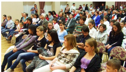
A Bordányi Kultúra Napján 2012-ben

A Magyar Kultúra Napját 1989 óta ünnepeljük január 22-én annak emlékére, hogy – a kézirat tanúsága szerint – Kölcsey Ferenc 1823-ban ezen a napon fejezte be Szatmárcsekén a Himnuszt. Az évfordulóval kapcsolatos megemlékezések alkalmat adnak arra, hogy nagyobb figyelmet szenteljünk évezredes hagyományainknak, gyökereinknek, nemzeti tudatunk erősítésének. A Községi Könyvtárban ezen a napon délután 4