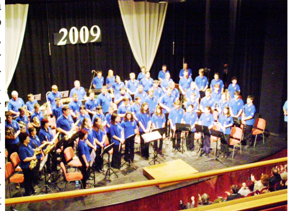
A fúvószenekar 2009-es fellépése a móraalmi rendezvényházban