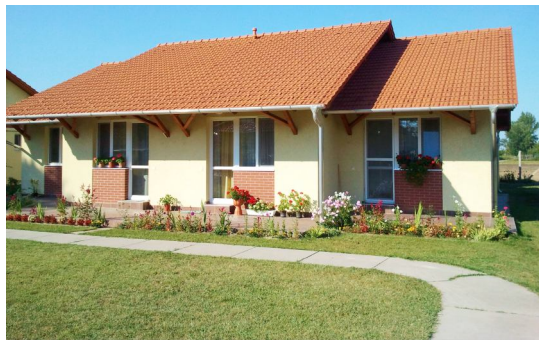
Nem kell tovább törleszteni a garzonok hitelet

Többször is beszámoltunk arról, hogy az önkormányzat nagyon nehéz anyagi helyzetbe került egy tavaly zajló, de még 2009-2010. évekre vonatkozó, az iskolában üzemeltetett családi napközi működtetéséhez kapott állami normatív támogatás felhasználása miatt indult ellenőrzés kapcsán. Az új vezetés nem tudott mit tenni, a Magyar Államkincstárnak összesen több, mint harminc millió forint állami forrást kellett visszafizetni az három-négy évvel ezelőtti szabálytalanságok miatt. Ez miatt szinte hiábavalónak tünnek az önkormányzatnál és intézményeinél foganatosított megszorítások, a számtalan spórolás, lemondás, hiszen a megtakarítások teljes összege a korábbi hibákért való helytállás martaléka lett. Az önkormányzat 2012-ben folyamatosan toltta maga előtt az újonnan keletkezett hiányt, sajnos a beruházások miatt az is előfordult, hogy hozzá kellett nyúlni a hitelkerethez is. A feszes gazdálkodásnak köszönhetően azonban eladósodásra mégsem került sor. Jó hír, hogy Bordány sikeresen pályázott a