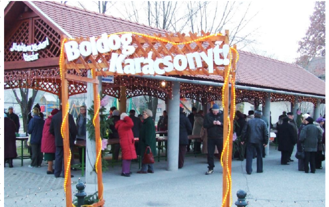
2011 advent első vasárnapján is sokan kilátogattak és jótékonykodtak

A Bordányi Gyerme- és Ifjúsági Önkormányzat kezdeményezésére, az idei évben immáron negyedik alkalommal, advent minden vasárnapján jótékonysági karácsonyi vásárt szerveznek Bordányban, a piactéren és az árubemutató csarnokban. A Faluház és az Egérház Alapítvány által is támogatott négy hétfvégés rendezvényre a tervek szerint az általános és alapfokú művészeti iskola növendékei valamint a helyi népdalkörök készülnek rövid karácsonyi műsorral. Az ifjúsági önkormányzat tagjai forralt borral és teával, valamint az elmúlt évekhez hasonlóan további meglepetésekkel kedveskednek a kilátogatóknak. A tervek szerint a civil szervezetek és az iskola osztályközösségei jótékonysági vásárral fogadják a bordányiakat, akik a vásárban elköltött minden forinttal programokat támogat-