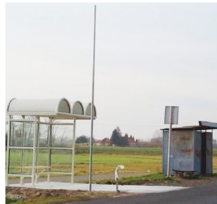
„Pusztá” típusú buszváró az Üllés-Szegedi oldalon

Jó ütemben halad a külterületi buszvárók építése. A kivitelező Délút Kft. a mai napon rakta helyre a „Pusztá” típusú buszvárókat az Üllés-Szegedi oldalon. A pályázati forrásból megvalósuló fejlesztés keretében az egyik oldalon a kibetonozott és bazaltbetonnal megerősített területre buszvárók, kerékpártárolók, szemétyűjtők, padok és kerékpártámaszok kerül-