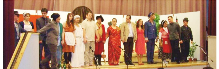
Az amatőr színészek nagy örömmel fogadták a közönség tapsát

10 éves születésnapját ünnepelte a hétvégén a Bordányi Amatőr Színjátszó Kör (BASZK). A jubileum alkalmából a társulat új szereposztással adta elő a Kukás Guru című darabot, amely ismételten elnyerte a bordányi publikum tetszését, így a darab végén nem maradhatott el a vastaps sem! Gratulálunk a szereplőknek és köszönjük a közönségnek, hogy ennyien részt vettek ezen az eseményen!