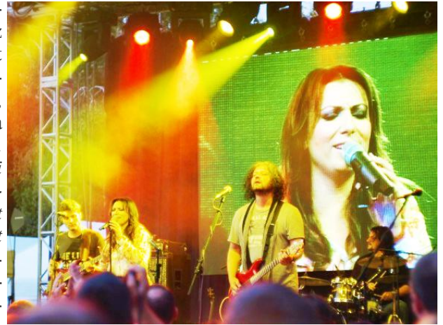
Pillanatkép Rúza Magdi egyik koncertjéről.