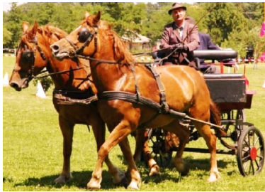
Különböző versenyszámokban kell bizonyítani.