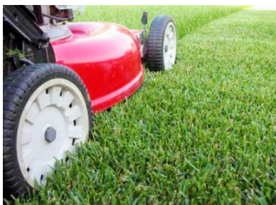
Készüljünk együtt a pünkösdi ünnepekre.

Bordány Község Önkormányzata az alábbiakban kéri a lakosság segítségét. A lakóingatlanok előtti közterület fűvágását elvégezni szíveskedjenek a pünkösdi ünnepek előtt, hogy településünk még barátságosabb, szebb képét mutathassuk be az ide érkező, várhatóan több száz vendégnek, turistának. Együttműködésüket ezúton is köszönjük!