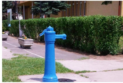
Megújultak Bordány tűzcsapjai és közkifolyói.

Pénteken estére teljesen megújultak településünk tűzcsapjai és közkifolyói. Az Önkéntes Tűzoltó Egyesület tagjai ragadtak ecsetet a kezükbe, és körbejárták a települést. Míg a tűzcsapokat pirosra, a közkifolyókat kékre festették, így a falu ünnepére minden földfelszíni vízszervelemény megszépülhetett.